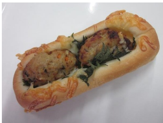
豆腐ハンバーグパン 150円 +税 ※シソの葉入りで、良い味出しています◎