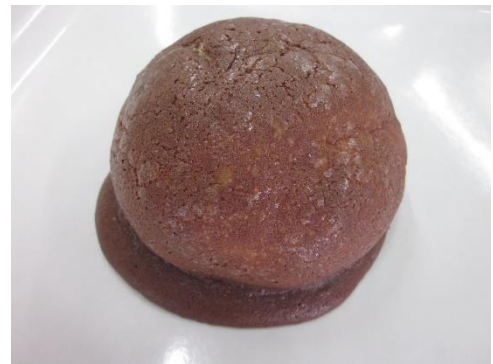
スイートメロンパン (チョコ) 150円 +税 ※サクサク生地です☆