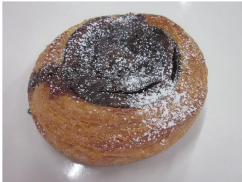
ショコラデニッシュ 150円 +税 ※チョコレート好きなら一度は食べてみて♪